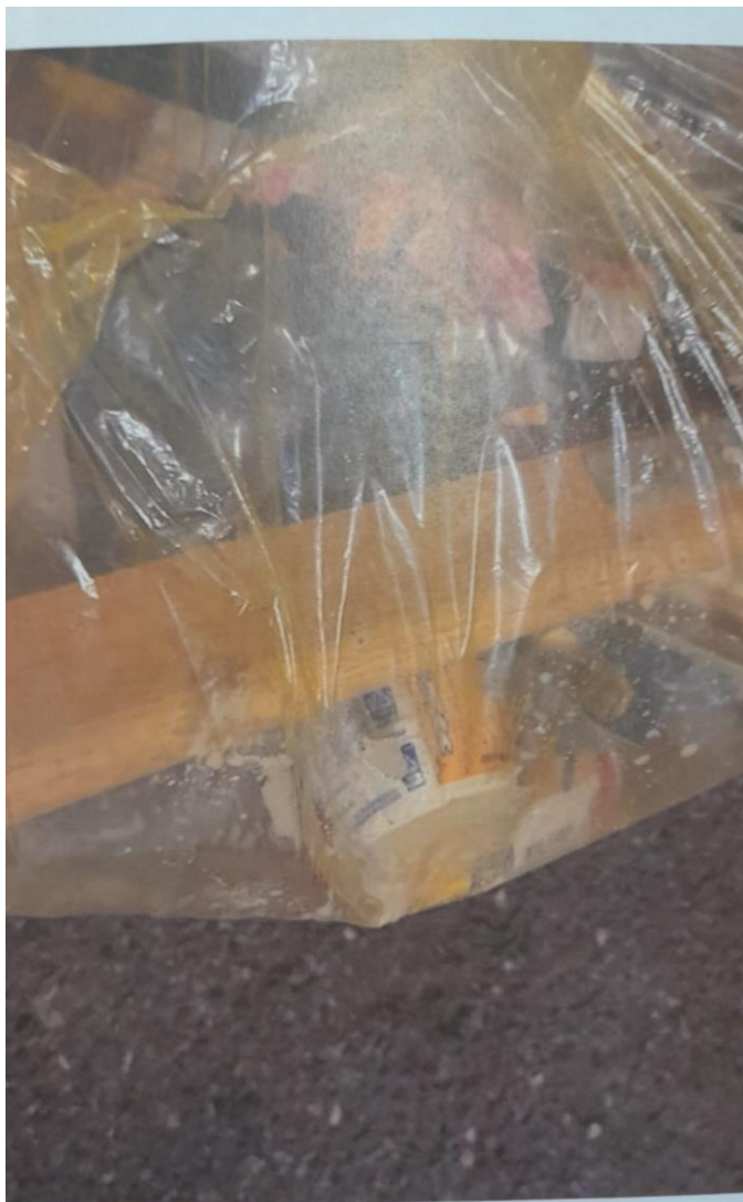
Presenza di pezzi di legno