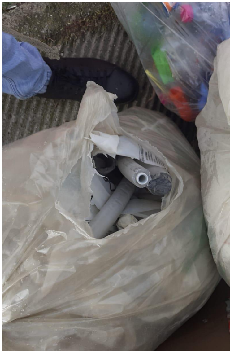
Presenza di tubi elettrici-tubi coibentati-tubi di gomma