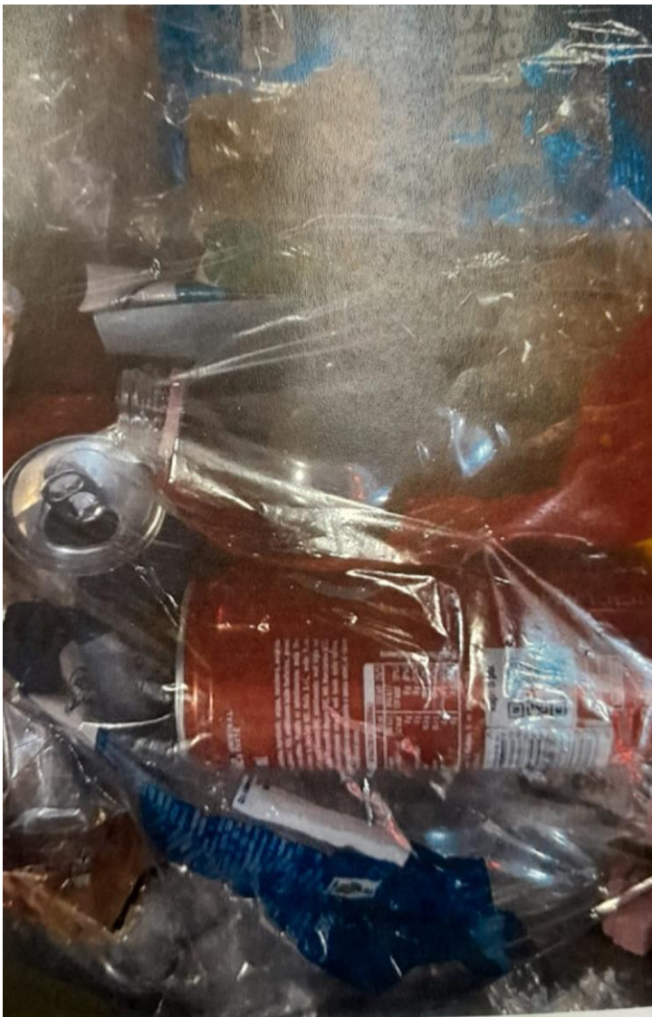
Presenza di lattine