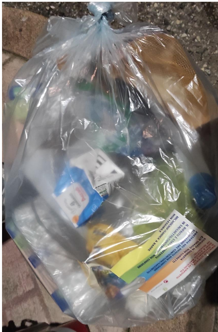
Presenza di carta e tetrapak